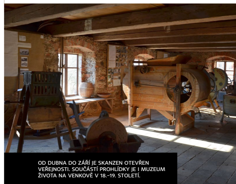
OD DUBNA DO ZÁŘÍ JE SKANZEN OTEVŘEN VEŘEJNOSTI. SOUČÁSTÍ PROHLÍDKY JE I MUZEUM ŽIVOTA NA VENKOVĚ V 18.-19. STOLETÍ.