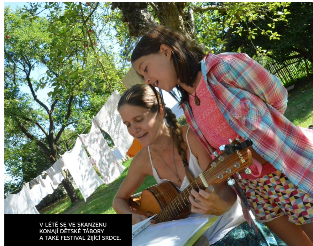
V LÉTĚ SE VE SKANZENU KONAJÍ DĚTSKÉ TÁBORY A TAKÉ FESTIVAL ŽIJÍCÍ SRDCE.

Žijící skanzen provozuje spolek Lunaria, který založil už v roce 1996 Zbyněk Vlk. Skanzen byl slavnostně otevřen na jaře 2009. Jeho součástí je renovovaný podstávkový dům, muzeum s historickými zemědělskými stroji a pomůckami, kovářská a truhlářská dílna nebo funkční větrný mlýn. Začíná u něj také dvanáctikilometrová naučná stezka, která návštěvníky provede po okolí Jindřichovic. Skanzen je otevřen veřejnosti od dubna do září. V létě se v něm konají různé řemeslné dílny, letní tábory pro děti a nově i festival o naplnění v životě.